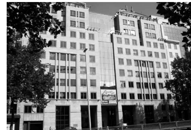
De kantoren van het Vlor-secretariaat in het Artemisgebouw in de Kunstlaan

Het permanent secretariaat organiseert voor zijn eigen medewerkers regelmatig interne vorming; dit werkjaar bijvoorbeeld over het hoger beroepsonderwijs en het gezondheidsbeleid op school. In functionerings- en evaluatiegesprekken wordt bij alle medewerkers systematisch gepeild naar individuele vormingsbehoeften. In opvolging daarvan volgden collega's vorming rond onder meer lees- en schrijftechnieken, softwaregebruik, coaching en personeelsbeleid. Er is een evaluatie- en opvolgingssysteem ontwikkeld voor gevolgde vormingen.